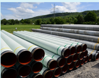
Rohrlagerplatz an der Trasse

Während der Bauphase wird ein sogenannter Arbeitsstreifen für die Lagerung von Bodenabtrag/-aushub und Material sowie für die Baufahrzeuge und Leitungsfertigung benötigt. Dieser knapp 30 m breite Arbeitsstreifen entlang des Leitungsverlaufs wird zunächst vermessen und dann auf archäologische Funde und Kampfmittel hin untersucht. Entlang der Trasse müssen zudem einige Bereiche zur Lagerung der Leitungsrohre eingerichtet werden.