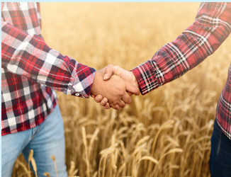
terrane ts bw legt großen Wert auf ein faires Miteinander

Die Zustimmung der Eigentümer und Bewirtschafter erfolgt über den Erwerb der Wegerechte, also Genehmigungen und Befugnisse im privaten und im öffentlichen Bereich, um Grundstücke für den Bau der Trasse zu nutzen.